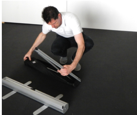
2 Stellfüsse querstellen. (90 Grad zum System)