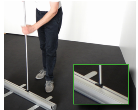
3 3-teiliger Stab zusammenstecken und in das System stellen.