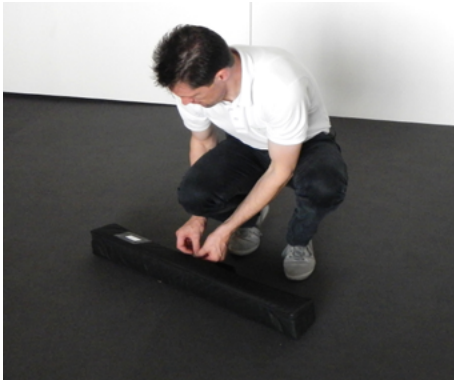
1 Rolldisplay inkl. Verpackung an der Aufbauposition platzieren.

Die Aufbauanleitung ermöglicht es Ihnen das Expand Rolldisplay mühelos aufzubauen. Bitte beachten Sie diese Anleitung für den Auf- und Abbau, so dass Sie lange Freude daran haben.