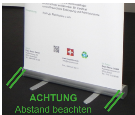
8 ACHTUNG: Abstand seitlich gleich!