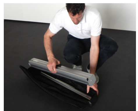
9 Rolldisplay und Stab in Tasche versteuen. Fertig!